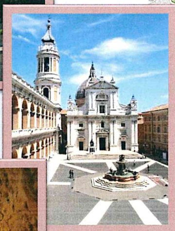
Macerata Recanati Loreto