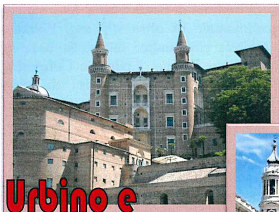
Urbino e Pesaro